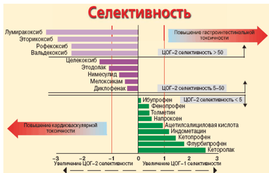
Рисунок 2. Распределение НПВП по степени селективности в отношении ЦОГ-1 и ЦОГ-2 [6].

интерлейкины, фактор некроза опухоли альфа и др.). Селективность действия НПВП оценивается по отношению степени ингибирования ЦОГ-2 к ЦОГ-1 (коэффициент селективности). Селективными ингибиторами ЦОГ-2 являются те НПВП, у которых данный